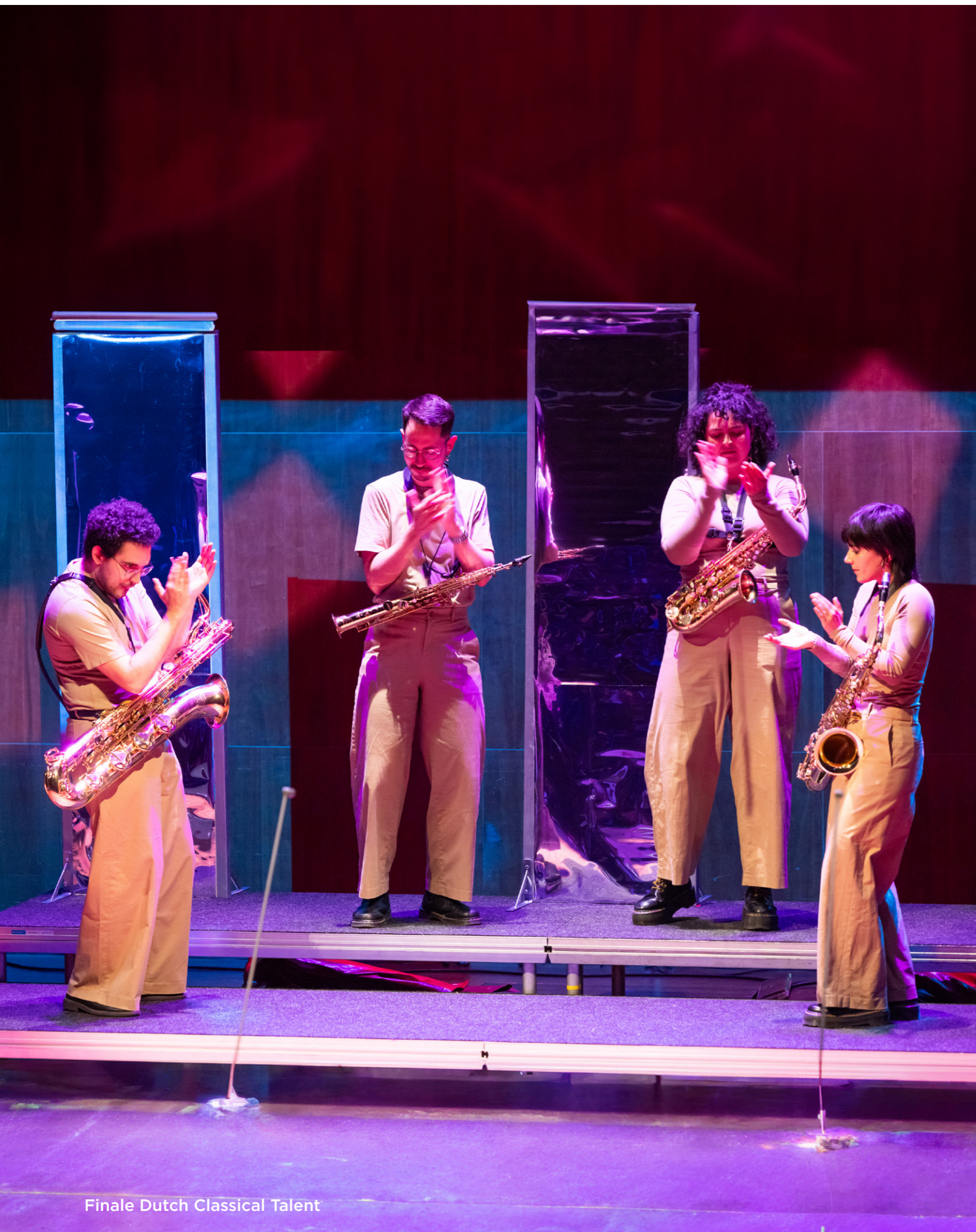
Finale Dutch Classical Talent